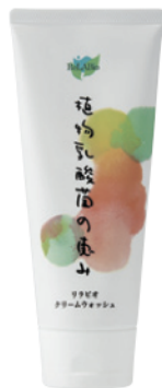
リラピオクリームウォッシュ 〈洗顔料〉 120g 2,838円(税抜)

広島大学との共同研究から生まれた乳酸発酵酒粕エキス SKG15 配合。きめ細かいクレーミィな泡が肌本来の機能を守りながら、やさしく汚れを落とします。